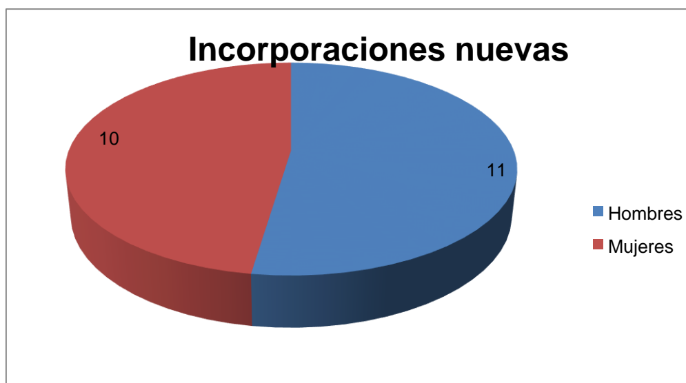
Gráfica 10 Distribución de las nuevas incorporaciones (año 2019)